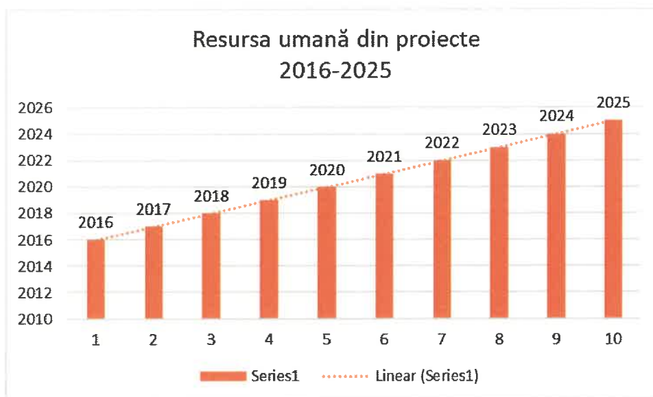
Figura 2. Cheltuieli cu resursa umană (2016-2025)