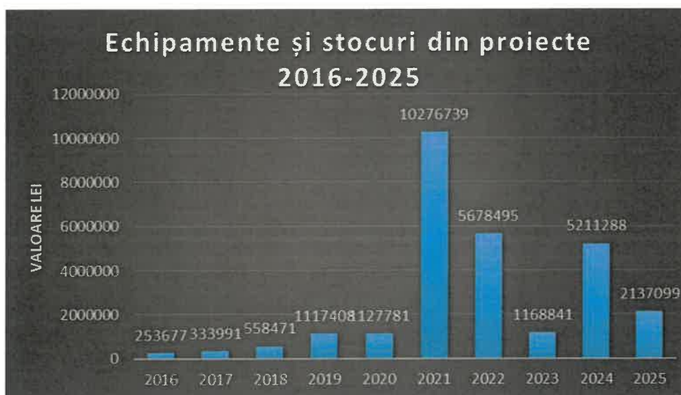
Figura 3. Echipamente și stocuri din proiecte (2016-2025)

Aprobat în Ședința Senatului Universității „1 Decembrie 1918” din Alba Iulia din 28 ianuarie 2026.