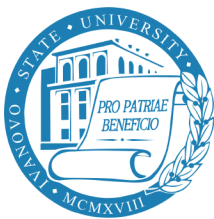
Ivanovo State University (Russia) https://ivanovo.ac.ru/