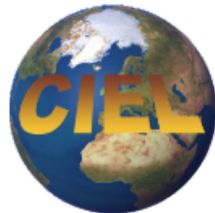
The Centre for Research and Innovation in Linguistic Education (Romania) http://ciel.uab.ro/