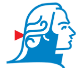
P.G. Yaroslavl State University (Russia) Institute of Foreign Languages https://www.uniyar.ac.ru/en/