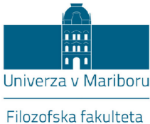
Faculty of Philosophy, University of Maribor (Slovenia) https://www.ff.um.si/